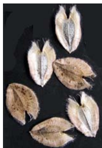
פְּרָעוֹנֵי כְּנָפוֹן זָהָב

השם הלועזי וֶרְבֵּינָה הומר בשם העברי כְּנָפוֹן על שום ההתרחבות הקרומית של פְּרוֹתִירֵזְרֵעוֹנוֹ המתפקדת ככנף.