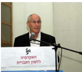
פרופ' אלישע קימרון