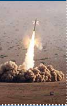
הארכיטקטורה של מלחמות המאה ה-21 עמ' 78

לא היי־טק אבל יעיל: בהמות משא בשירות הצבא, עמ' 46