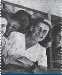
מחנה השבויים הישראלים באום אל-ג'ימאל עמ' 56