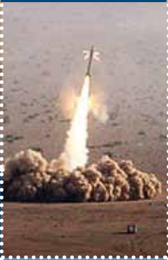
הארכיטקטורה של מלחמות המאה ה-21 עמ' 78

לא היי־טק אבל יעיל: בהמות משא בשירות הצבא, עמ' 46