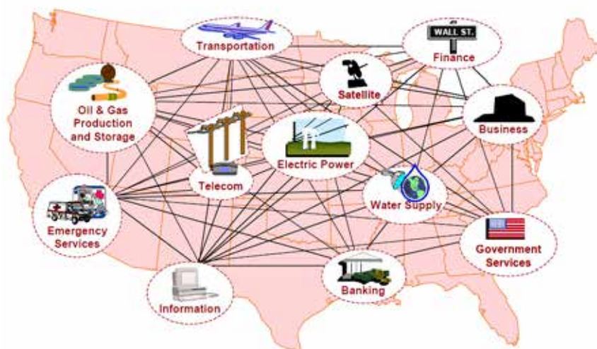
איור 1: תשתיות חיוניות קשורות ותלויות זו בזו בארצות הברית

Gillette, J., Fisher, R., Peerenboom, J. and Whitfield, R. (2006). המקור: Analyzing Water/Wastewater Infrastructure Interdependencies . Lemont, Illinois: Infrastructure Assurance Center – ANL (Argonne National Laboratory): April 01, 2006.