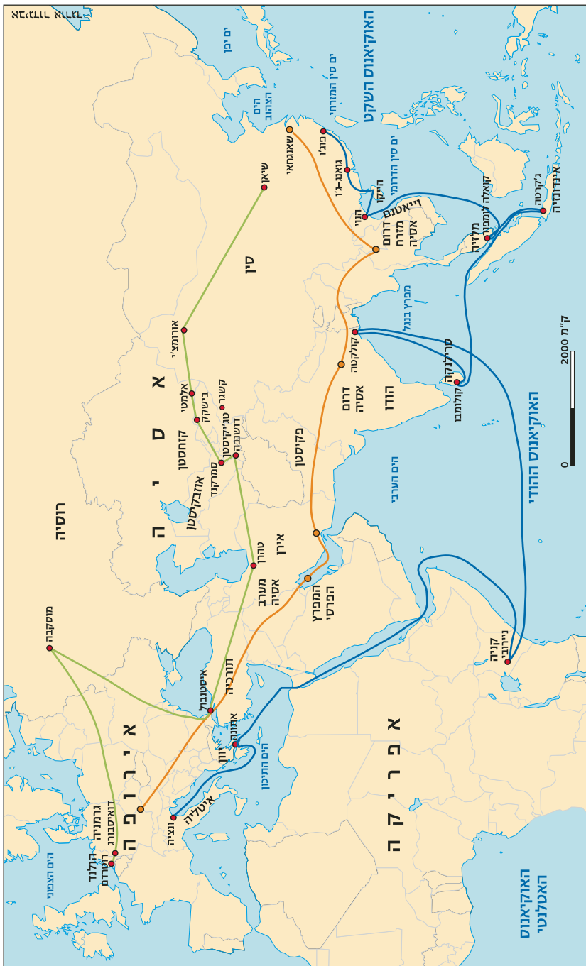
איור 1: נתיבי יבשה ימים של יוזמת 'חגורה אחת, דרך אחת'