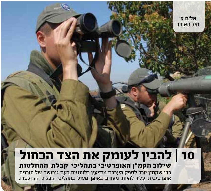
אל"ם א' חיל האוויר